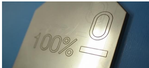
レーザーでこんな彫刻も!