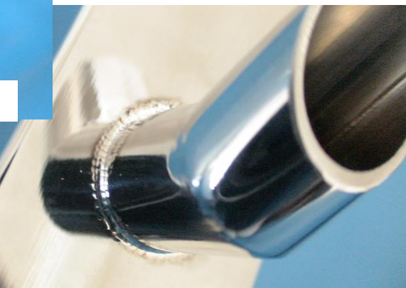
筒部分もこのように仕上がります