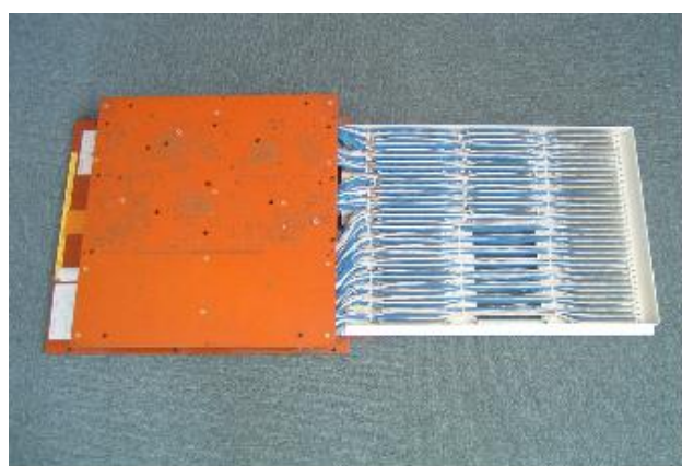
◎標準ベアボード治具