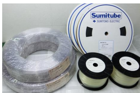
チューブ等切断素材