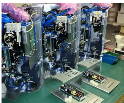
各種ユニット組立